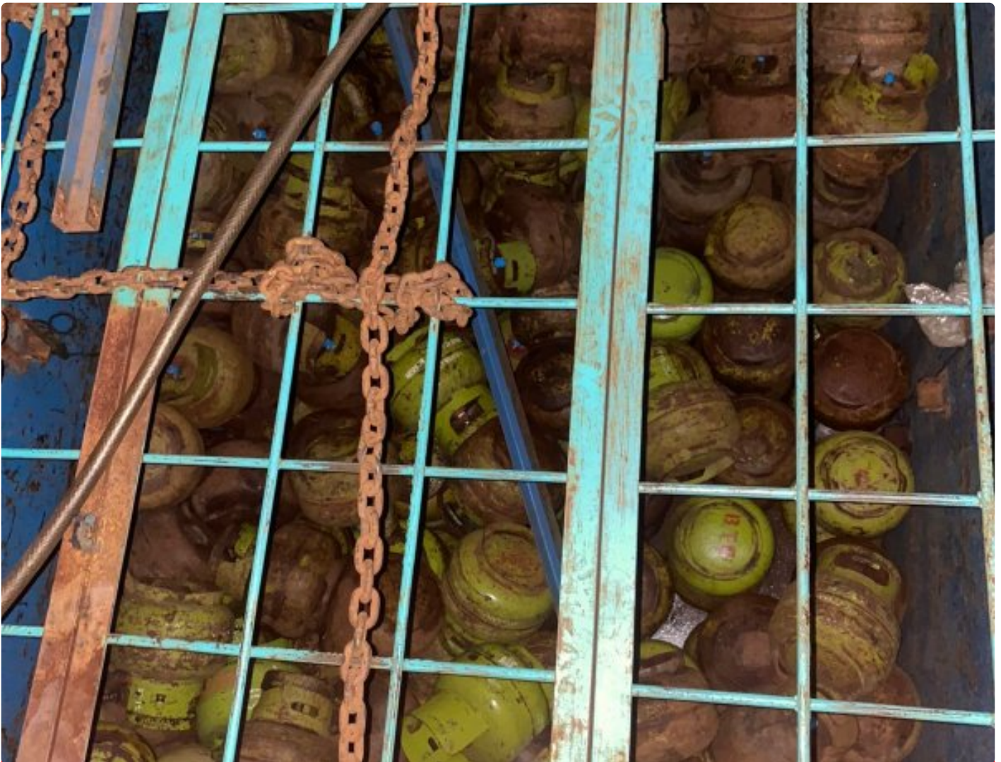
Tabung LPG 3 Kg bersubsidi yang amankan jajaran Polres Morowali

MOROWALI, Sulawesi Tengah- Jajaran Polres Morowali, Polda Sulteng baru-baru ini berhasil mengungkap kasus tindak pidana penyalahgunaan LPG 3Kg bersubsidi.