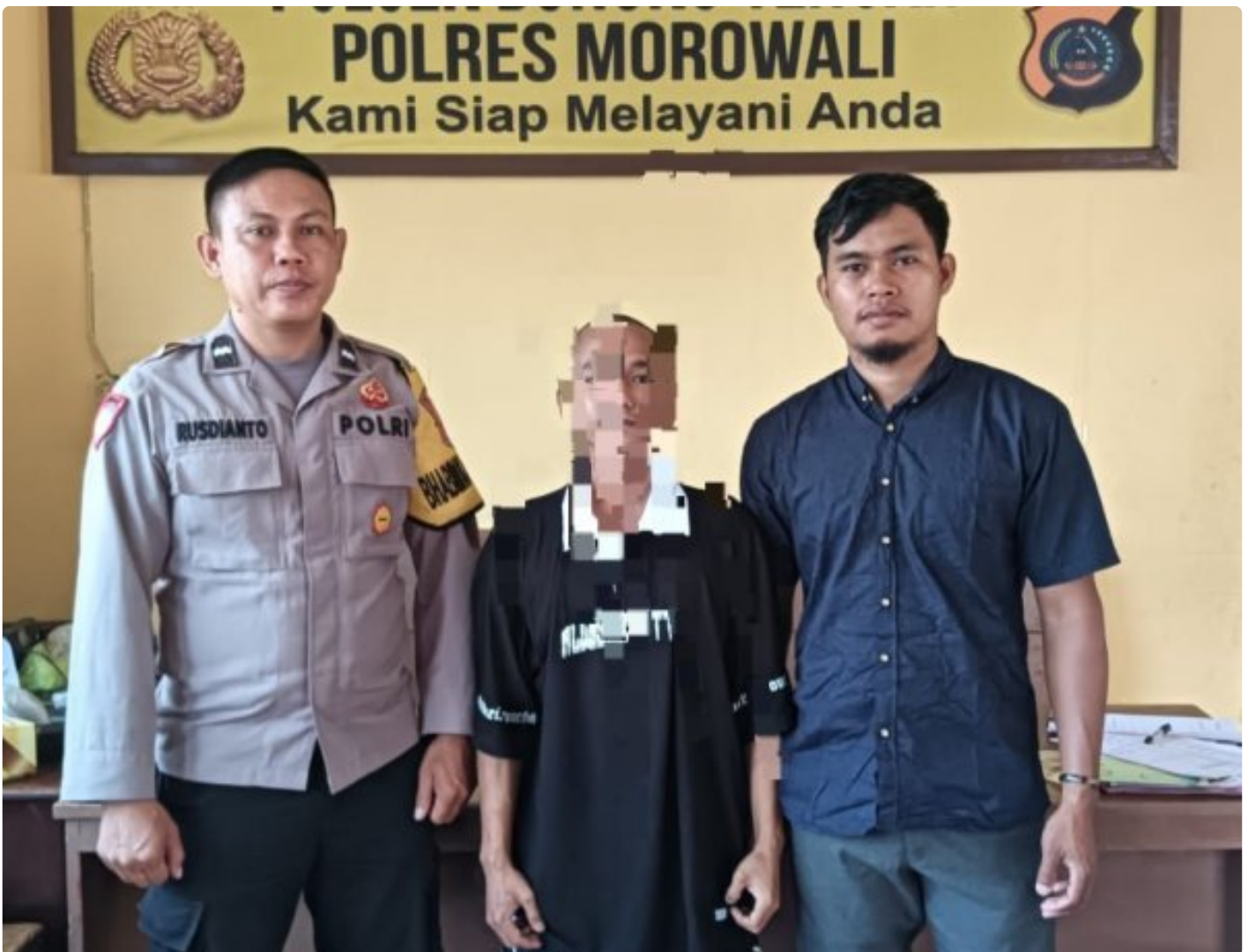
Aparat Polsek Bungku Tengah Berhasil Tangkap Pelaku Curanmor

MOROWALI, Sulawesi Tengah- Pada Hari Sabtu 5 Oktober 2024 Sekitar Pukul 18.30 Wita Kepolisian Sektor (Polsek) Bungku Tengah Polres Morowali, berhasil mengungkap kasus pencurian kendaraan bermotor (curanmor) yang terjadi di